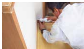
クロスのすきま補修