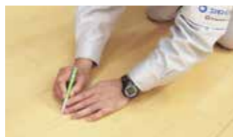
フローリングの補修