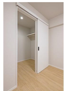
ウォークインクローゼット