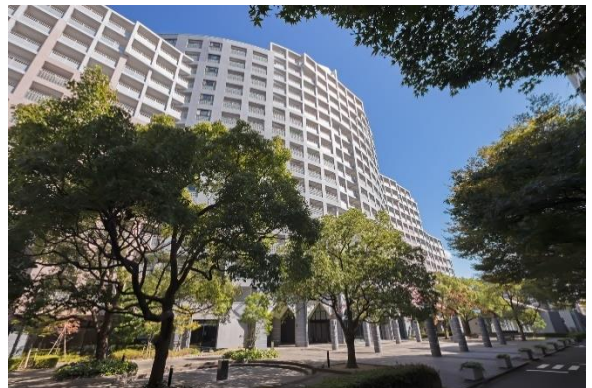
『シーサイドももちクリスタージュ壱番館』外観

住宅地として人気の高い百道浜エリアに位置し、百道浜小学校、百道中学校などが近く、教育環境が充実しています。近隣には百道中央公園があり緑豊かで子供が遊べる公園があり、また福岡山王病院をはじめとする医療施設も多く、安心してお住まいいただけるエリアです。敷地の広さを生かした広場、集会室、広いロビーがあり、共用部が充実しているマンションです。