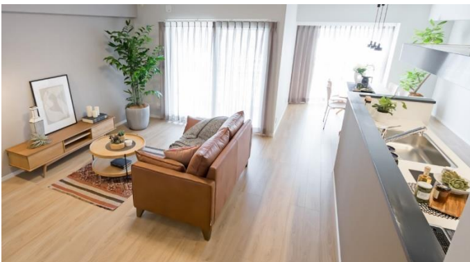
キッチン・リビング