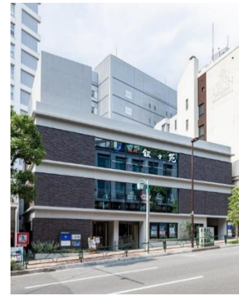
『セレサージュ目黒イースト』・『セレサージュ目黒ウエスト』外観