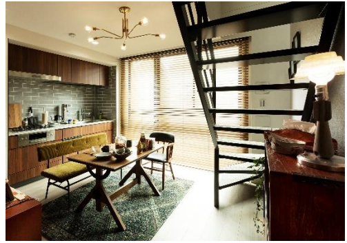
『イニシアテラス目黒学芸大学』 type2N モデルルーム

『イニシアテラス目黒学芸大学』のプランにおける一番の特長は、全邸が上下階の2フロアに分かれたメゾネットタイプであることです。2つのフロアで構成されるメゾネットは、家族が集まる共用フロアと個々の時間を楽しむプライベートフロアといったように戸建住宅感覚でフロアの使い分けができ、立体的な空間構成を活かして変化に富んだレイアウトをつくることも可能です。さらに階段下をオープンスペースにすることで、シェルフで“見せる収納”を作るなど、好みやライフスタイルに合わせた空間づくりを楽しめるように工夫を施しました。