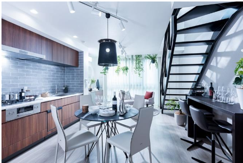
『イニシアテラス目黒学芸大学』type2K モデルルーム

大和ハウスグループの株式会社コスモイニシアは、新築タウンハウス『イニシアテラス目黒学芸大学』（東京都目黒区、総戸数15戸）を2021年11月13日から第1期1次登録受付を開始することをお知らせします。