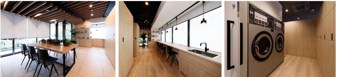
『イニシア大手前』 Good enough Lounge コワーキングスペース&トランクルーム(左・中) ランドリーコーナー(右)

「あったら便利だけど所有するとスペースをとる。」「すぐに使いたいけれど買うほどではない。」そんな掃除道具や工具類を集めたシェアツールボックスがマンション1階にあることで、部屋の中はすっきり。もっと好きなものに囲まれて暮らせます。