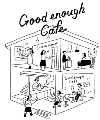
イメージイラスト

1階はカフェや展示・ミーティングスペース、2階はモデルルームとなっております。これからマンションを購入しようと考えている方だけでなく、カフェでくつろぎたい方も、気が向いたときに立ち寄って、おいしいコーヒーでほっとひと息つくことができる空間になるよう考えました。どなたでも気軽に見学いただけるように、スタッフによるご説明は希望される方のみへのご案内とし、ご自分のペースで自由に見学いただける街にひらかれたマンションギャラリーとなっております。