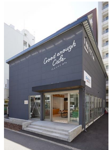
『Good enough Gallery』外観