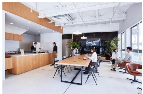
『イニシア大手前』外観（左） ・ カフェ併設のマンションギャラリー『Good enough Gallery』（右）

『イニシア大手前』は、4 駅 5 路線利用可能な交通利便性の高い立地でありながら、大阪城公園をはじめとした自然のやすらぎを感じられる、大阪城の西に位置する「大手前エリア」に誕生しました。室内に自在に使える土間スペースや DEN スペースをプラスし、1DK・1LDK のコンパクトながら効率的で豊かな暮らしを実現できる間取りを計画。共用部には、ワークスペースやランドリーだけでなく、ストレージ機能やシェア倉庫など、多様化するライフスタイルをよりスマートにする専有部+αのスペース・サービスをご提案しています。