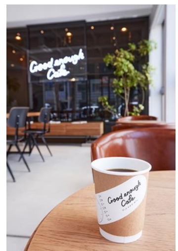
『Good enough Gallery』1F カフェスペース