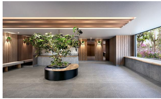
『イニシア横浜天王町』 モデルルーム (左) / エントランスホール完成予想 CG (右)