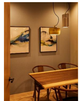
『イニシアラウンジ三田』 カフェエリア（左） / 「parkERs」オリジナル什器（中央） / ミーティングルーム（右）