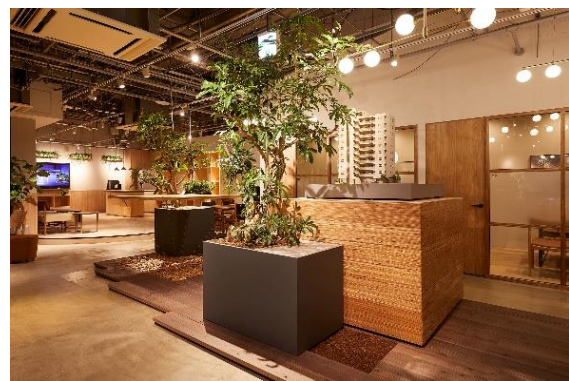
『イニシアラウンジ三田』 エントランス (左) / 模型エリア (右)

『イニシアラウンジ三田』は、当社が販売する複数の新築マンションの情報や当社の住まいに関わるご提案事例などの情報を取りそろえており、お客さまが情報を閲覧したり検索したりすることができます。今後はリノベーションマンションや新築戸建、中古マンションなど、当社が取り扱う「INITIA」ブランドの幅広い選択肢の中から同時に検討することができる総合ギャラリーを目指し、随時ご案内物件のラインアップを増やしてまいります。お客さまが、洗練された居心地のよい空間のなかで、当社の住まいに関する多くの情報を効率的に収集しながら楽しく購入体験ができる場を創出し、お客さまにとって最適な住まいや暮らし方をご提案してまいります。