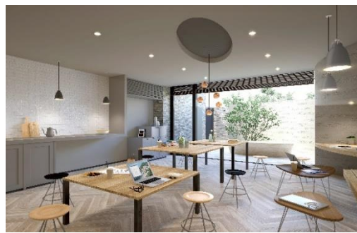
『イニシア青砥レジデンス』モデルルーム(左) / 共用ラウンジ完成予想CG(右)