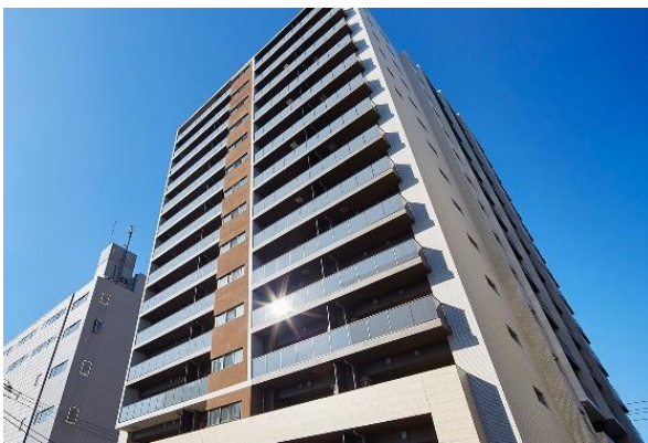
『イニシア大森町N'sスクエア』 建物外観

大和ハウスグループの株式会社コスモイニシアは、新築分譲マンション『イニシア大森町N'sスクエア』（東京都大田区、総戸数112戸）が2021年1月に竣工したことをお知らせします。