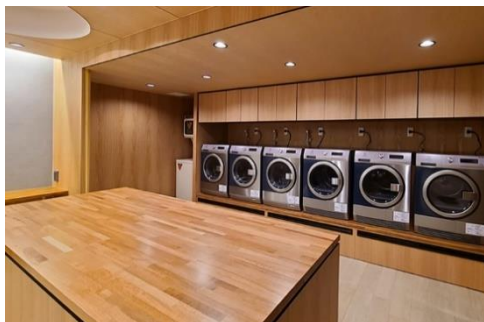
高機能ランドリー

<宅配収納サービス「sharekura（シェアクラ）」> 自宅に居ながら荷物の預け入れや取り出しができるクラウド型トランクルーム。「持たない」暮らしにより専有部のスペースを広々と使うことができます。