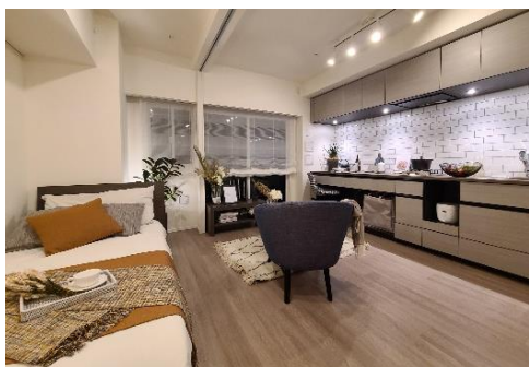
モデルルーム E タイプ

1～3LDKの多彩なプランがある中で、特に1LDKプランでは、壁付けキッチンを最大限活用した新しいコンパクトプランのライフスタイルを提案。キッチンカウンターだけでなく、ダイニングカウンターやデスクとしても使用できるよう、カウンター下部は椅子が入るようにオープンに設計するなど、コスモスイニシアならではの「すごしかた」にこだわったプランニングを行いました。