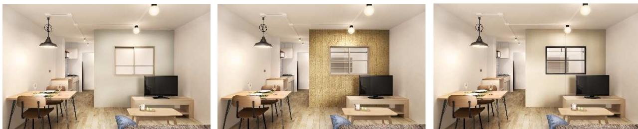
選べる壁イメージパース 左:ナゴミウォール 中:キナリウォール 右:ブコツウォール