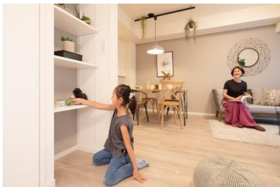
洋室の棚板可動式収納スペース

子ども部屋内収納スペースの棚板が可動式で、子どもの成長に合わせて、調整しやすい配慮をしています。