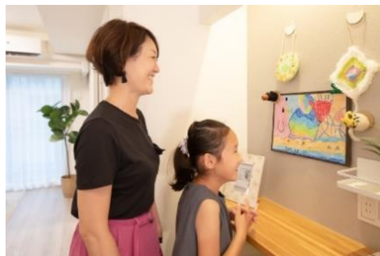
リビング・ダイニングのコミュニケーションボード

子どもの作品や家族同士のメッセージを飾り、コミュニケーションが円滑に進むよう配慮しています。