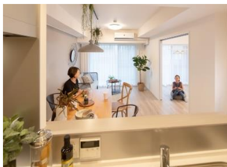
キッチンからの目線

キッチンから、リビングやリビング隣接の子ども部屋が見渡せ、遊んだり、お昼寝する子どもの様子を確認出来ます。