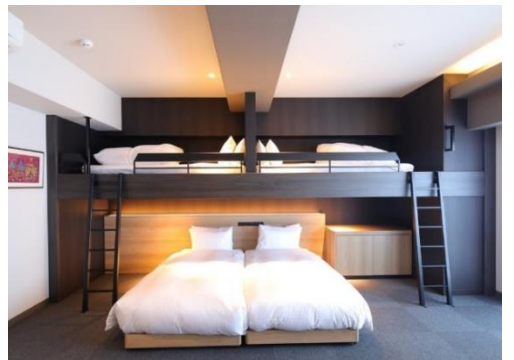
『MIMARU 京都烏丸御池 NORTH』客室

ホームページ： https://mimaruhotels.com/ja-jp/karasuma-oike-north/