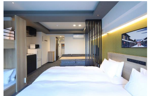
『MIMARU 京都 STATION』客室

ホームページ： https://mimaruhotels.com/ja-jp/kyoto-station/