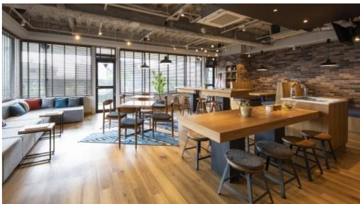
共用ラウンジ・テラス（キッチン・ミニコンビニつき）