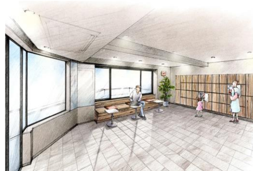
青砥スタンド（共用ラウンジ）完成予想イラスト

HP: https://www.cigr.co.jp/pj/shinchiku/A10083/index.html