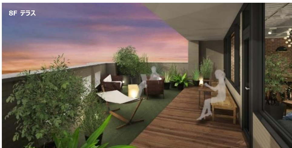
8F ラウンジ・テラス