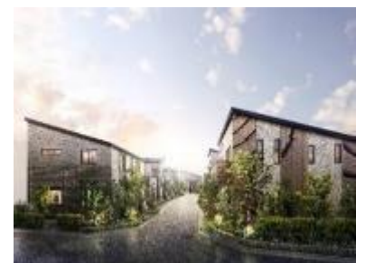
『イニシアフォーラムひばりヶ丘』外観パース