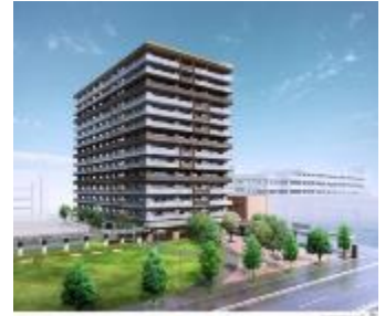
『イニシアグラン札幌イースト』外観パース

人生100年時代を迎える中、 アクティブシニアのための、 一歩先の自由な発想でつくる、 お一人おひとりが心満たされる住まい。