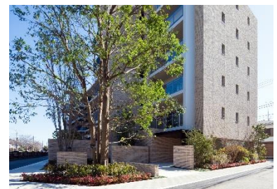
『イニシア池上』外観