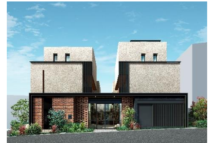
『イニシアテラス代々木上原』外観パース

憧れの住宅地に、 デザインされた立体空間で 個性豊かな暮らしを かなえる住まい。