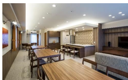
スカイビューラウンジ