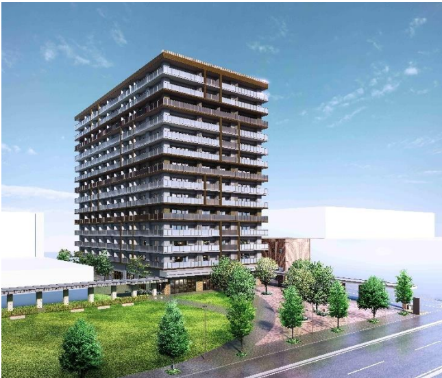
『札幌北 4 東 6 周辺地区再開発プロジェクト』 完成予想図