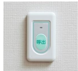
緊急コールボタン