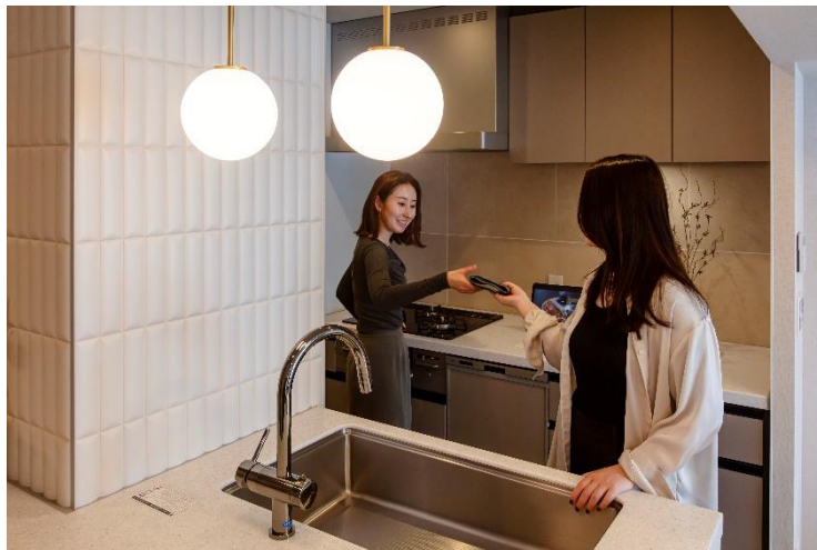
女性同士のカップルに向けたリノベーション住戸

※LIFULL HOME'S がLGBTQカップルの住宅購入の課題解決に向けて「LGBTQのためのマイホーム相談会-FRIENDLY DOOR FES-」を5月16日、17日に初開催: https://lifull.com/news/48241/