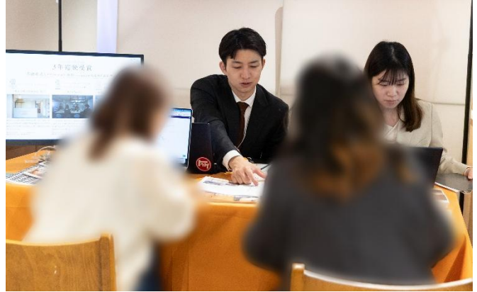
イベント当日の様子