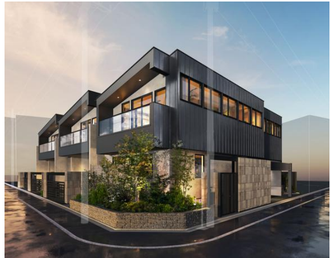
『イニシアフォーラム二子玉川 The Hill』 (左)全体区画イメージイラスト／(右)街並み完成予想 CG

『イニシアフォーラム二子玉川 The Hill』は、atelier9 建築研究所の建築家 呉屋 彦四郎(ごや ひこしろう)氏により、世田谷区瀬田四丁目の地に刻まれてきた歴史と、時代を受け入れながら重層的に風景を育んできた“時代の厚み”に着想を得て設計されました。各邸宅のアプローチを直接公道に接続する区画割りとし、高いプライバシーに配慮した配棟計画を実現。内部空間においては東西に伸びる敷地形状を生かし、南側の開口部を大きく確保。外部からの視線を気にすることなく、2 階リビングに豊かな採光と空の広がりを楽しむことができるデザインとしました。