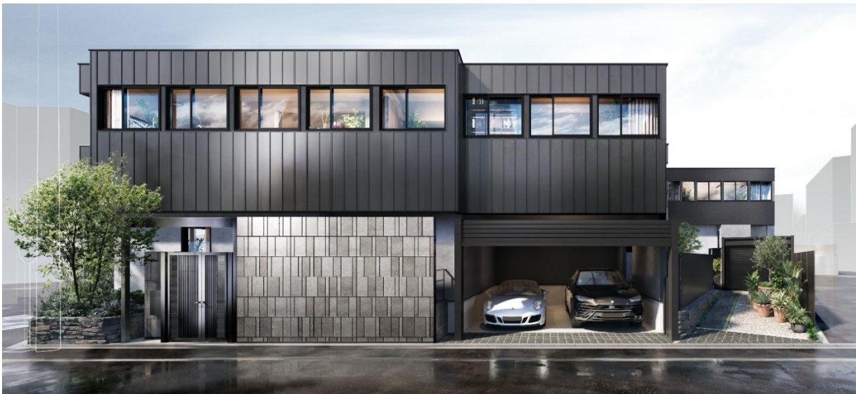
『イニシアフォーラム二子玉川 The Hill』完成予想CG

公式ホームページ: https://www.cigr.co.jp/pj/shinchiku/D20486/