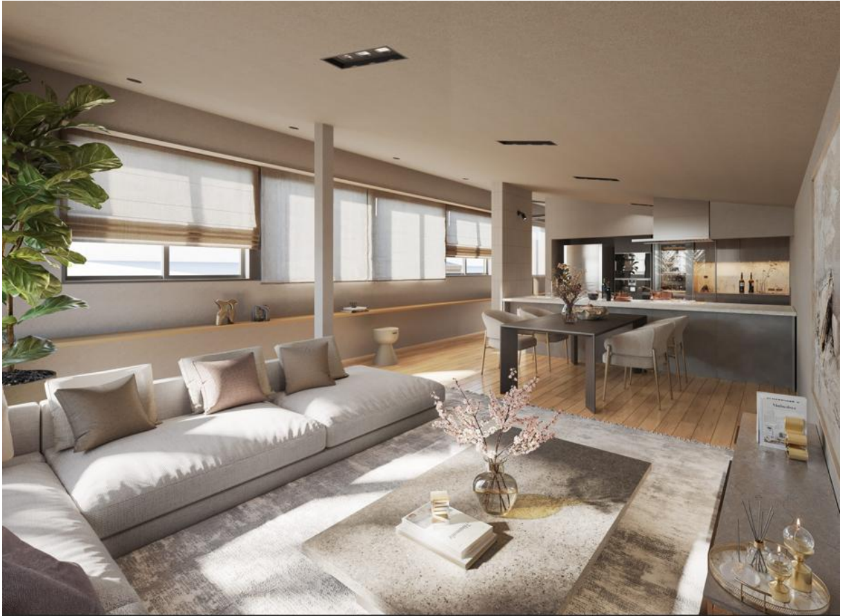
『イニシアフォーラム二子玉川 The Hill』 3号棟リビングダイニングキッチン完成予想 CG