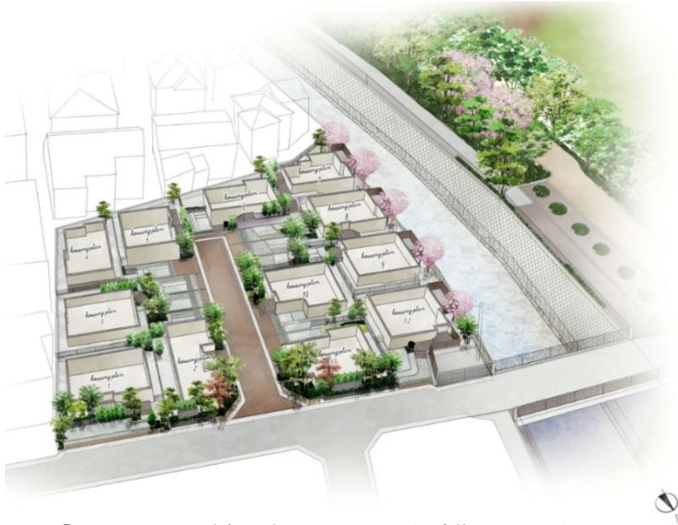
『イニシアフォーラム永福町パークサイドステージ』全体区画イメージイラスト

本物件は第一種低層住居専用地域および風致地区の規制より守られた良好な景観を活かし、開放的で統一感のある街並みをデザインしています。