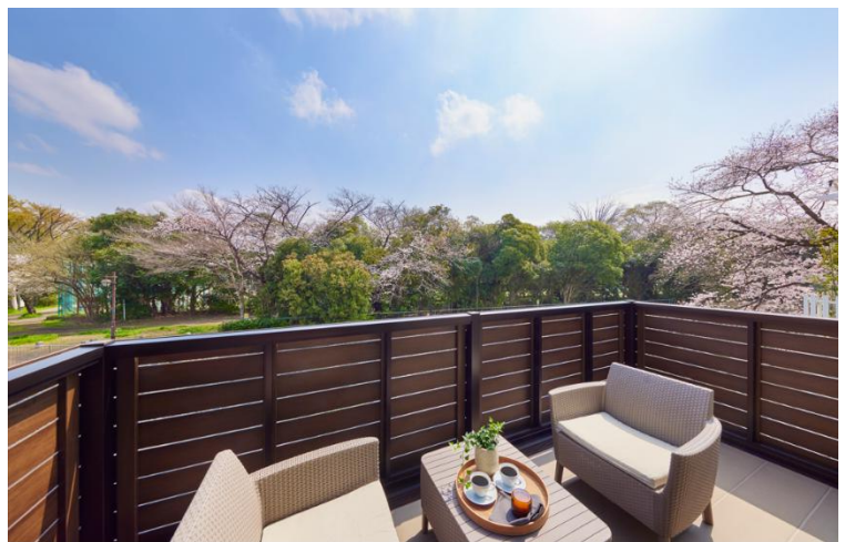
『イニシアフォーラム永福町パークサイドステージ』 HOUSE-7:1階ウッドデッキより和田堀公園を臨む