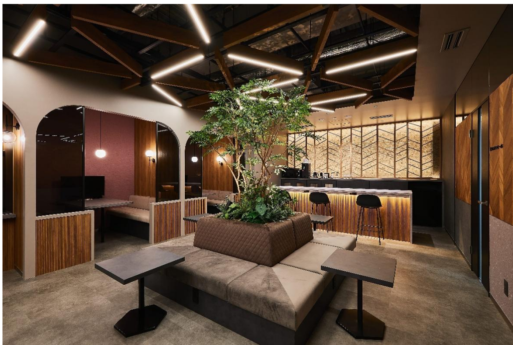
『MID POINT 六本木』

また、第15拠点目となる『MID POINT 浦和』の2026年3月開業が決定しました。開業に先立ち、『MID POINT 浦和』のホームページ( https://www.cigr.co.jp/mp/urawa/ )にて、WEB 内覧および入居者募集を開始いたしました。