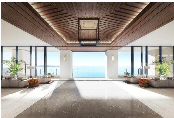
▲エントランスロビー完成予想 CG