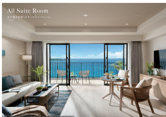
▲リビングダイニング完成予想CG