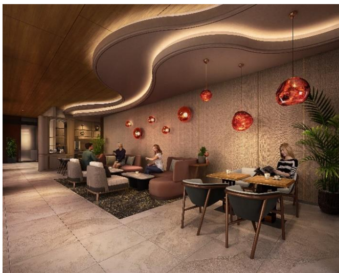
▲クラブラウンジ完成予想 CG

※掲載の完成予想 CG は計画段階の図面を基に描き起こしたもので、実際とは異なる場合がございます。今後行政の指導、施工上の理由等により外観、仕様、色彩等に変更が生じる場合がございます。