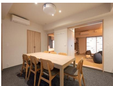
7名まで泊まれる広いお部屋

「まどい」とは円く集まること、楽しく会合する団らんのことを言います。仲間と集まる機会が増えてきたいま、ゆったりと飲み明かしていただけるようなお部屋をご用意しました。「まどいの極み部屋」は、欧米ゲストからも人気の高い、靴を脱いで足を伸ばせる和室に、車座でくつろげるビーズクッションを並べました。また、ホテルでセレクトした日本酒やビールなどのアルコール類に加え、スナックや駄菓子、ナッツなどを、ご宿泊代金にオールインクルーシブでご準備しています。さらに、リラクゼーショングッズやボードゲームもフリーで使える、至れり尽くせりの特別ルーム。お部屋に入って、部屋着に着替えたなら、時間やまわりを気にせず、「まどい」の極みをお楽しみください。