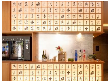
「SAKE サーバー」でチョイ飲み