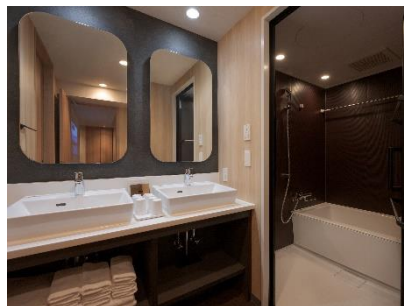
ゆったりとした洗面・浴室