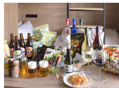
お酒とおつまみをお部屋にセット