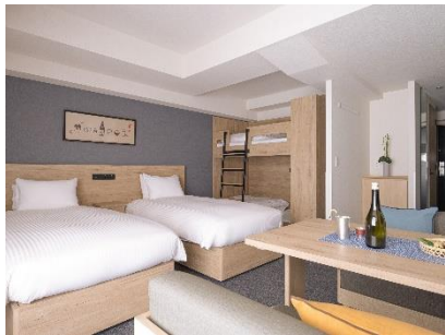
バンクベッドのあるお部屋

※4. 2022年10月時点の予定。料金は客室・時期により異なります。詳細はMIMARU公式サイトをご覧ください。