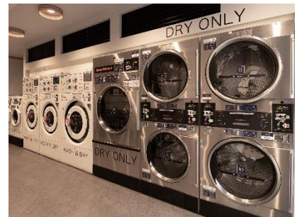
中長期滞在便利なコインランドリー