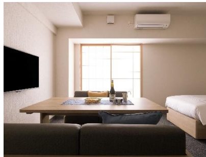
広いダイニングテーブル