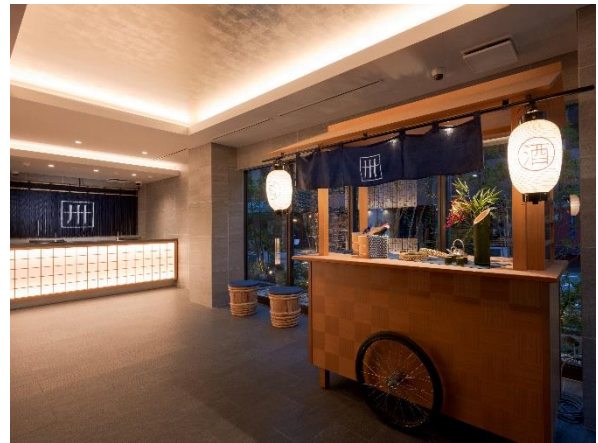
『MIMARU大阪 心斎橋EAST』1Fロビー「IZAKAYA」

『MIMARU大阪 心斎橋EAST』は、定員4~7名の広いお部屋で、海外のファミリーはもとより、友人同士、学生時代の仲間、子どもの成人されたご家族など、美味しいお酒や食とともに、“みんなで泊まる”旅をお楽しみいただけます。和室で車座になり、ゆったりと飲んだり食べたりできるコンセプトルーム「まどいの極み部屋」もご用意しました。日本酒やビールといったアルコール、駄菓子、スナック、ナッツ類などのおつまみを、あらかじめお部屋にセット(無料)してあるので、買い出しに行く手間もなく、お部屋に入ったら、すぐに「ほろ酔い」時間をスタートできます。