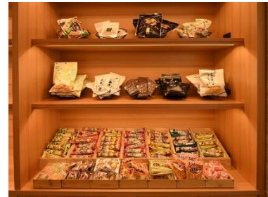
駄菓子の袋詰め放題