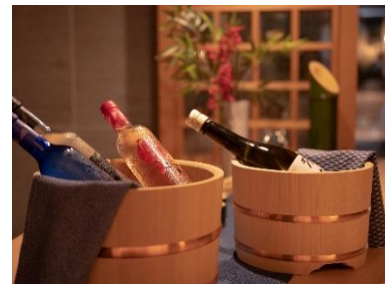
セレクトしたお酒