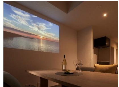
プロジェクター付きのシアタールーム