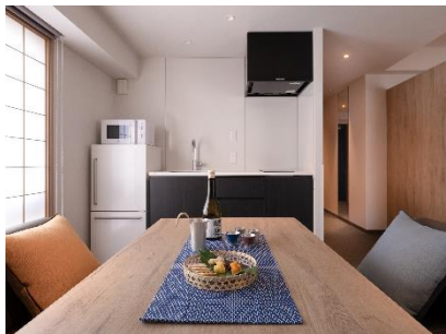
全室キッチン・ダイニングつき