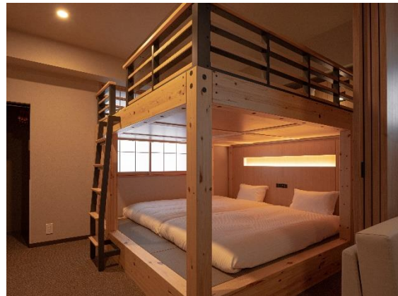
キングバンクベッドルーム