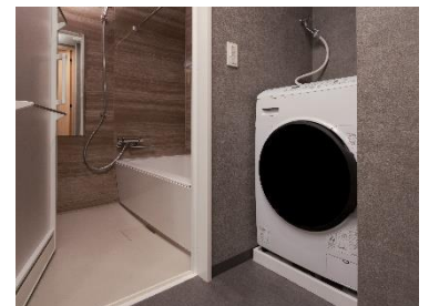
メインバスルーム・洗濯乾燥機

「MIMARU」シリーズ同様、キッチンには食器や調理器具が揃い、外食だけではなく、地元の食材を使って料理をしたり、近くのお店のテイクアウト、デリバリーを利用したりするなど、旅先の食事も思いのままに。室内には2つのバスルームと洗濯機を備えており、ゆっくりお風呂につかったり、洗濯したり、自宅にいるような時間をお過ごしいただけます。