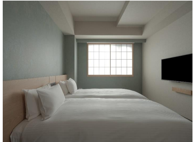
『MIMARU SUITES 東京日本橋』客室 (リビング・キングバンクベッドルーム、主寝室)

「MIMARU」は、みんなで泊まる「み(んなで泊)まる」が名前の由来。アクセスの良い都市部に立地し、約40㎡からの広い客室にキッチンやリビング・ダイニングスペースを備えた、多人数での滞在やインバウンドニーズに対応する都市型アパートメントホテルです。2021年に京都四条に誕生した新シリーズ「MIMARU SUITES」は、全室2ベッドルーム以上のスイートタイプで構成されています。大人グループや多世代旅行、欧米ファミリーなど、区切られた個室を求めるゲストにも対応できるよう、客室にリビング・ダイニングと2つの独立したベッドルームを設けました。家族や友人、趣味の仲間と、街や客室内リビング空間で共に楽しみながら、それぞれでくつろぐ時間も大切にできます。