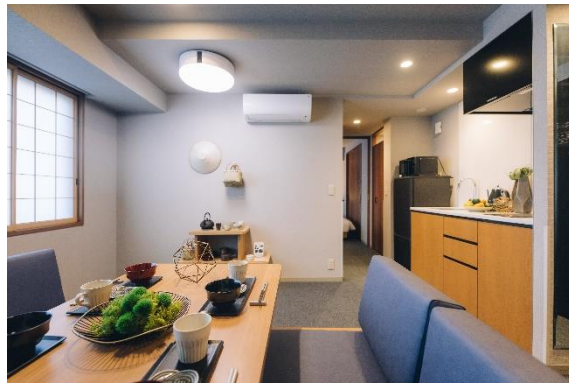
2ベッドルームスイート