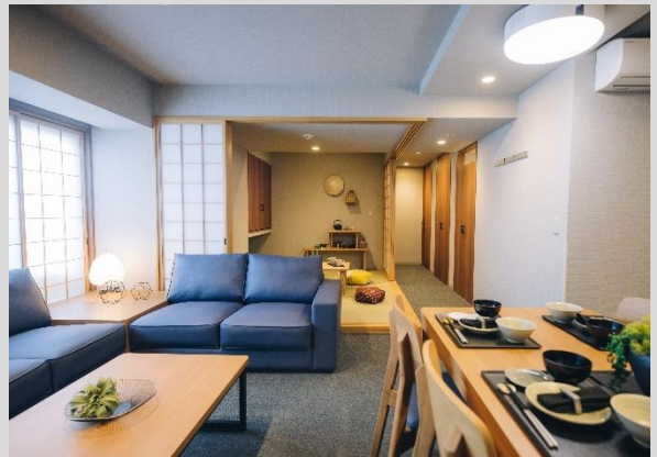
「MIMARU SUITES」シリーズ 客室例 リビング・ダイニングキッチンと 2つ以上の独立した寝室