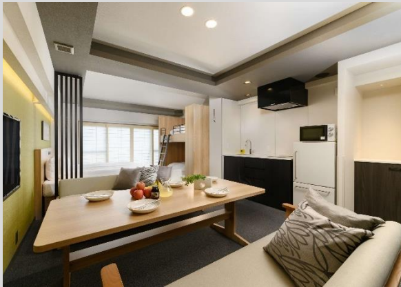
「MIMARU」シリーズ 客室例 約40㎡からの広い空間 ワンルームタイプ中心