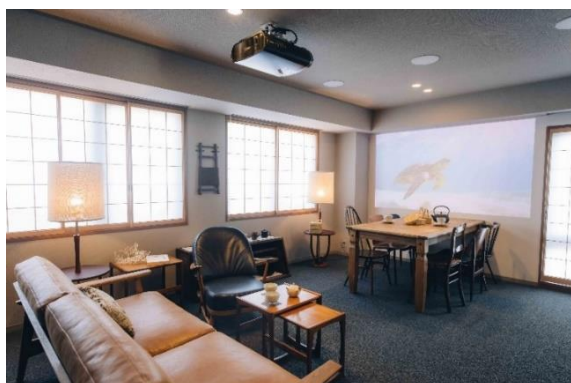
プレミアム2ベッドルームジャパニーズスイート

※3 2021年7月開業時の販売想定価格平均です。料金は客室・時期により変動します。詳細はHPをご確認ください。