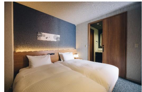
主寝室 (プライベートバス付き)

全室リビング・ダイニングに加え、2つ以上のベッドルームで構成された、プライベート空間を確保する設計で、それぞれの生活時間に合わせたすごし方が可能です。就寝時間が異なる場合でも気兼ねなくおすごしいただけます。また、メインベッドルームには、プライベートバスルームもご用意しています。