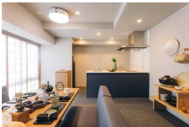
『MIMARU SUITES 京都四条』客室 (リビング・ダイニング)

「アパートメントホテル ミマル (MIMARU)」は、約40㎡からの広い客室にキッチンやリビング・ダイニングスペースを備え、ご家族・グループでの中長期滞在ニーズに対応する都市型アパートメントホテルです。このたび、新しく誕生する「MIMARU SUITES」は、全室2ベッドルーム以上のスイートタイプで構成された「MIMARU」の新シリーズです。コロナ禍で一層多様化するライフスタイルに合わせ、その街で暮らすような自由な滞在を楽しんで欲しい、という思いから、より広い客室に、リビング・ダイニングとベッドルームを分け、プライベート空間を確保しました。旅先の街や客室で家族や仲間と楽しみながら、それぞれの時間も大切にする、“暮らすような滞在”を一層追求した都市滞在型旅行をお届けします。