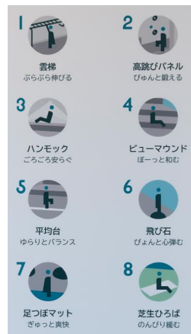
パークフロア「kenpa」案内図