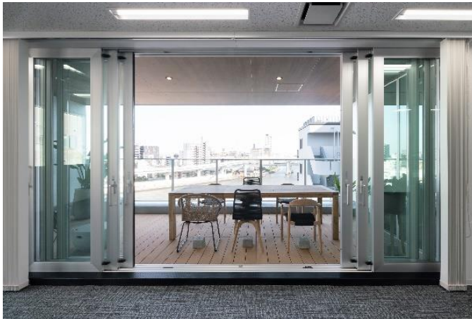
『クロスシー東日本橋ビル』7階専有部 大型テラス