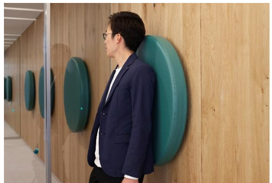
共用部エントランス使用のファブリック