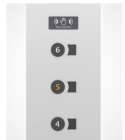
非接触式エレベーターボタン

荷物を持ったままでも手をボタンに近づけるだけで階数の選択ができ、感染症拡大防止対策にも対応した非接触式エレベーターボタンを採用しました。