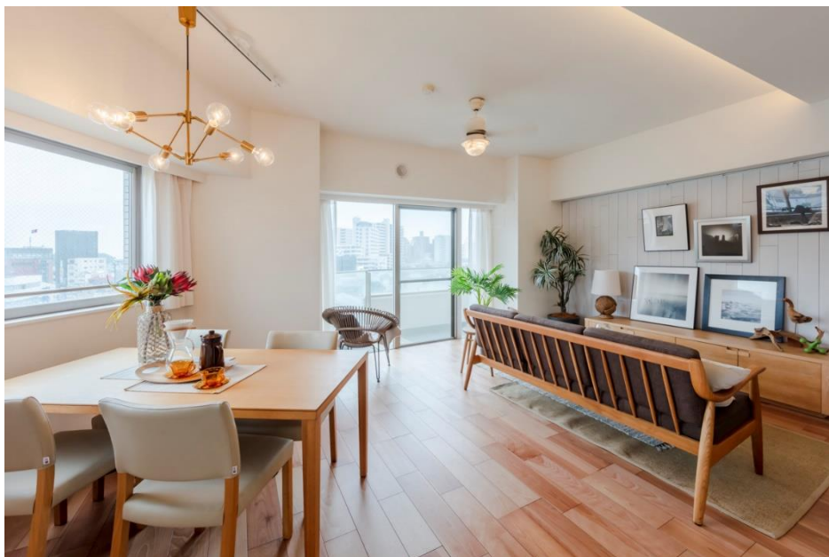
『湘南タワーズ』リビング・ダイニングルーム

大和ハウスグループの株式会社コスモイニシアは、リモートワークや郊外移住ニーズの高まりなど「ニューノーマル」の暮らし方に対応する、郊外型リノベーションマンションの展開を開始します。第1弾物件の『湘南タワーズ』が5月に竣工し、販売を開始しましたので、お知らせします。