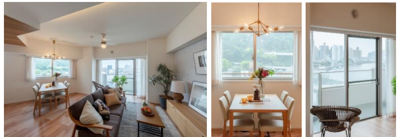
『湘南 Towers』ダイニングから片瀬山・リビングから江ノ島方面を臨む

江ノ島や片瀬山を臨む、眺望の開けたリビング。日々過ごしているなかで、視線の先にふと外の景色が浮かび上がるよう、空間構成に配慮しています。