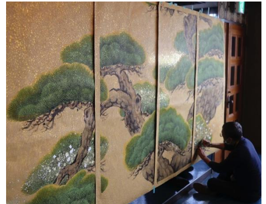
エントランス襖絵パネル制作風景 (金砂子技法を使用した襖絵装飾)

「APARTMENT HOTEL MIMARU」( https://mimaruhotels.com/ )は、全客室キッチン付き、ダイニングスペースも備わった広い客室で、ゆったりと落ち着いてご自宅のようにおくつろぎいただけます。