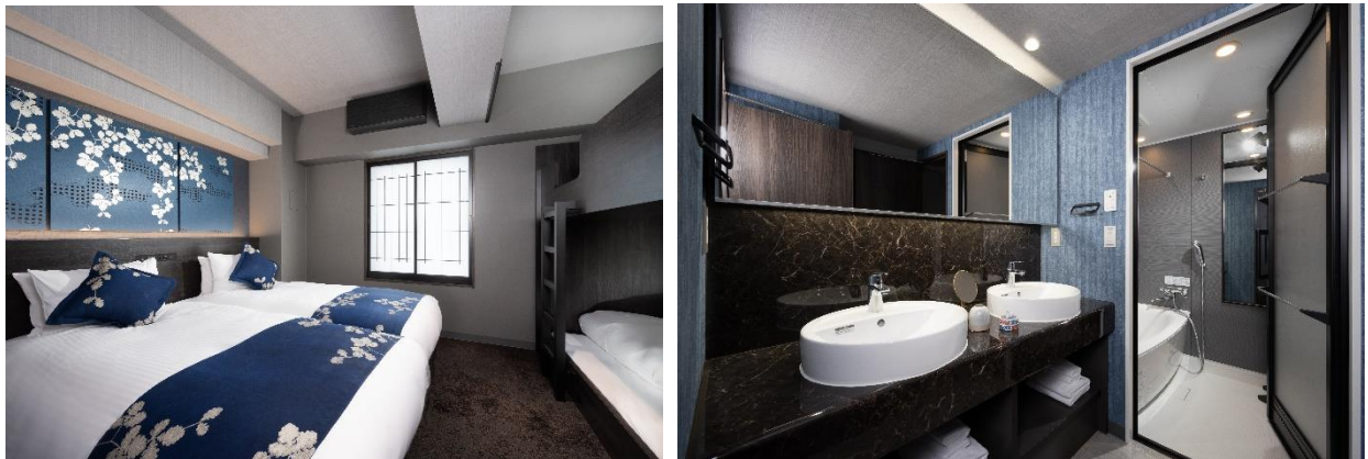
プレミアムルーム（ベッドルーム・洗面・浴室）