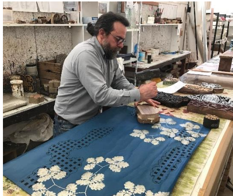
プレミアムルーム内装材制作風景 (イタリアの木版で越前和紙に印刷)