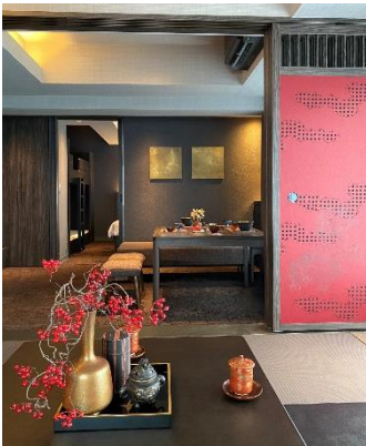
プレミアムルーム写真 (夏水組監修)

当施設は、客室・エントランスを株式会社夏水組がデザイン監修し、イタリア老舗メーカーBERTOZZI（ベルトツィ）社による手彫り木版のハンドプリントや伊勢型紙と呼ばれる型紙を用いた内装材で装飾を施すなど、高級感と落ち着きのある客室をご用意し、伝統工芸を気軽に体験いただけるサービスもご提供します。また、大阪メトロ「四ツ橋」駅徒歩2分、「心齋橋」駅徒歩6分の駅から近い立地ながら、落ち着いてすごしやすい周辺環境でワーケーションなどの中長期滞在にも適しています。