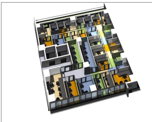
『MID POINT 川崎』執務エリア