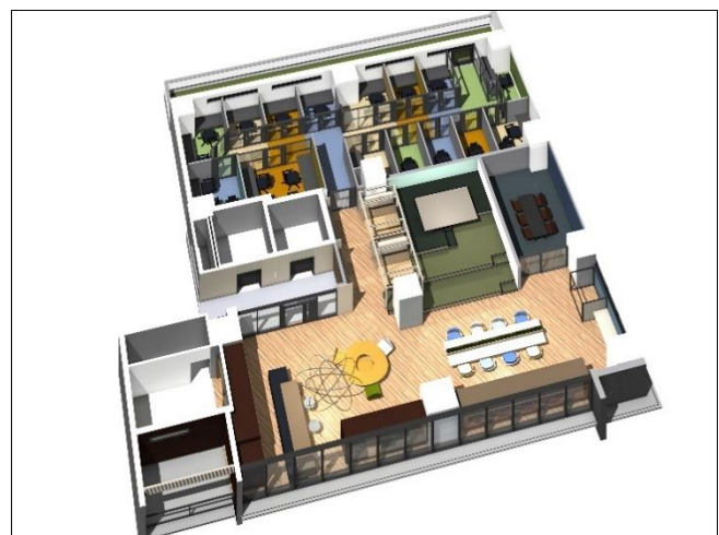
『MID POINT 川崎』9F ラウンジフロア