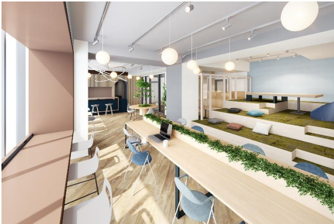
『MID POINT 川崎』ラウンジ完成予想 CG

大和ハウスグループの株式会社コスモイニシアは、「職住近接」を実現するレンタルオフィス『MID POINT（ミッドポイント）』の第5弾となる『MID POINT 川崎』（神奈川県川崎市）を、JR「川崎」駅から徒歩3分、駅直結の大型商業施設や、集合住宅が建ち並ぶ西口エリアにおいて、2021年4月に開設することとなり、本日から入居者の申込受付を開始しますのでお知らせします。