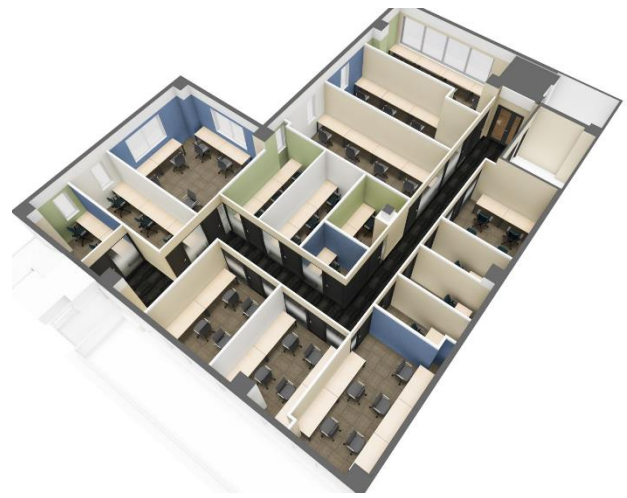
3階フロアプラン完成予想 CG