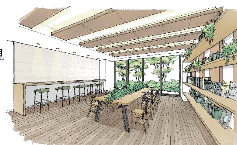
ブックシェアコーナーイメージイラスト