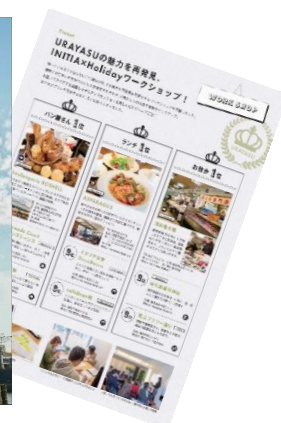
ライフナビゲーション

「Holiday」浦安ページ https://haveagood.holiday/search/浦安