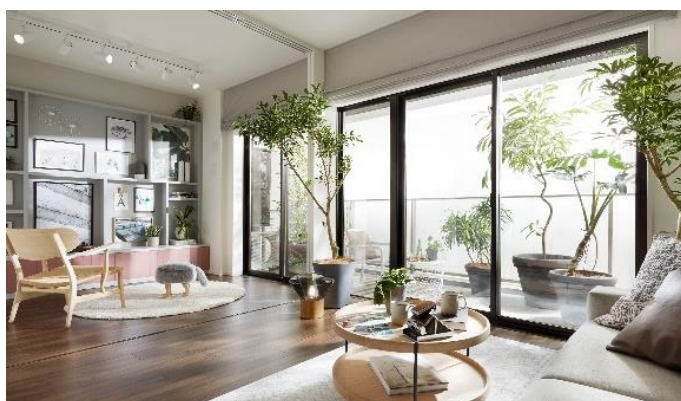
『イニシア浦安グランプレイス』モデルルーム

『イニシア浦安グランプレイス』は、都心に近く、周りには新しい発見や季節の楽しみを感じるスポットが数多く存在する浦安市北栄に誕生します。「SHARE THE PLEASURE まいにちに、たのしさとつながりを」をコンセプトに、人と人とががつがることで、たのしみやゆとり、こだわりを分け合う暮らしを提案しています。