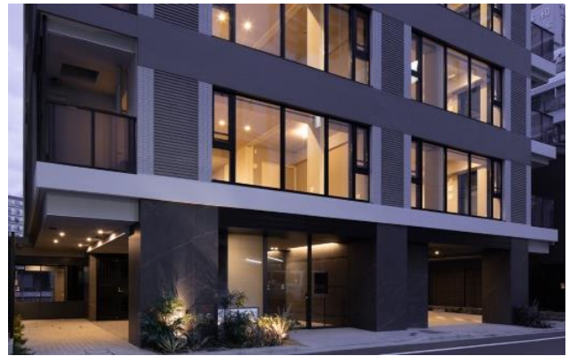
建物エントランス