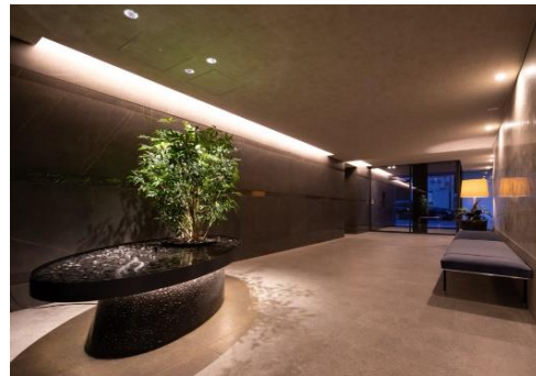
建物エントランスホール