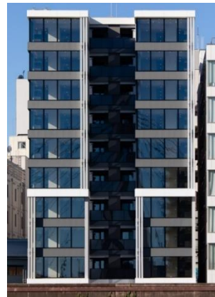
建物外観（隅田川側から撮影）