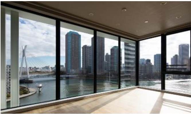
コーナーサッシを採用した建物内観

『イニシア中央湊』は、銀座・東京至近の都心利便と華やぎがある立地でありながら、自然風景広がる隅田川のほとりに誕生しました。隅田川に面した住戸にはコーナーサッシを採用することで開放感のあるリビングを実現し、マンションの顔である共用エントランスホールでは緑と水のやすらぎの空間を演出するなど、日々の忙しい暮らしの中に癒しを取り入れる住まいを計画しました。