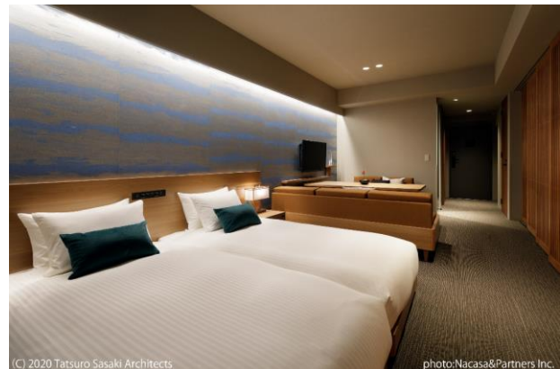
客室 (定員 4 名・夏デザイン)