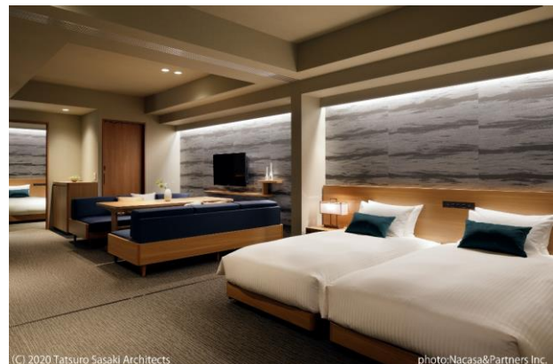
2 ベッドルーム客室 (定員 6 名・冬デザイン)