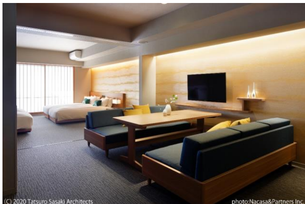
2 ベッドルーム客室 (定員 6 名・秋デザイン)