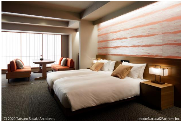
客室 (定員 4 名・春デザイン)