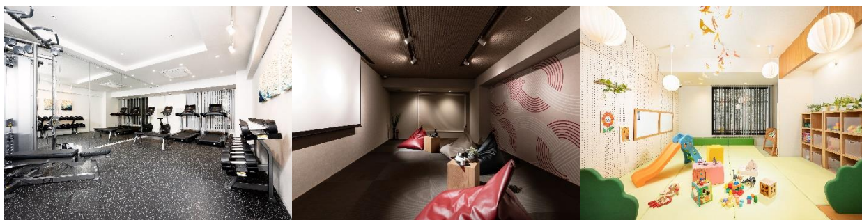
フィットネスジム

共用部には、「MIMARU」初となるフィットネスジムやエンターテインメントルーム、キッズルームを設けており、中長期滞在中のリフレッシュのほか、ゲスト同士の交流や日本文化を体験していただくさまざまなイベントに活用する予定です。