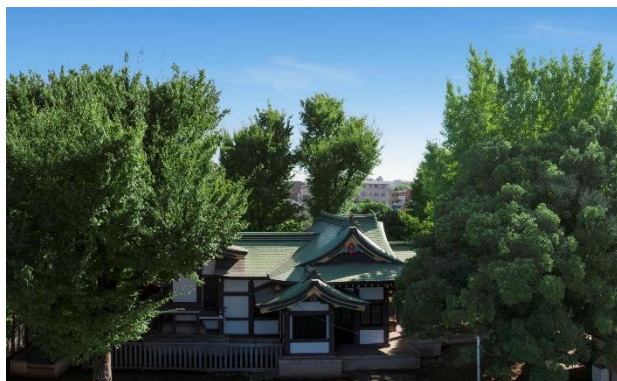
エントランスアプローチ・現地からの眺望（「蓮根氷川神社」方向）（2013年撮影）