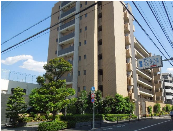
『イニシア蓮根氷川の杜』外観

※修景：都市計画・道路計画などで、自然の美しさを損なわないように風景を整備すること