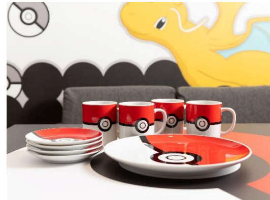
「ポケモンルーム」室内写真

東京・京都の「MIMARU」5施設※で、オリジナルデザイン「ポケモンルーム」をご用意しました。「ポケモンルーム」ご宿泊のお客さまは、モンスターボール柄オリジナルカトラリーも利用可能です。また、オリジナルノベルティグッズもプレゼントします。