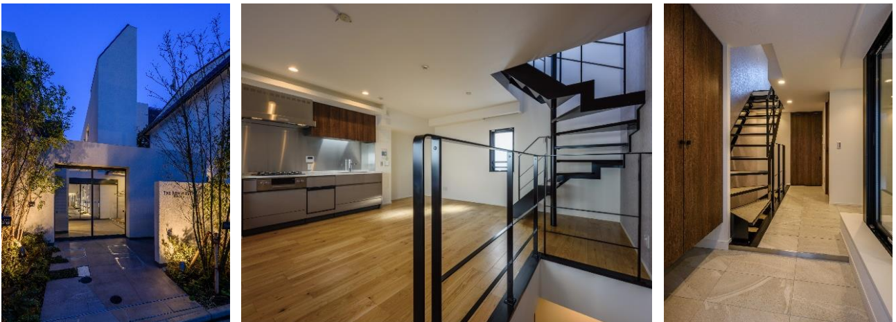
『ザ・ロアハウス吉祥寺』路地を構成するアプローチ・1層から3層の多様なプラン

上下階の大きささまざまな空間に連続性のある住まい「重層的都市住居」を計画。住まい手が場面や用途により自在に編集し、住みこなすことができる空間を提案しました。