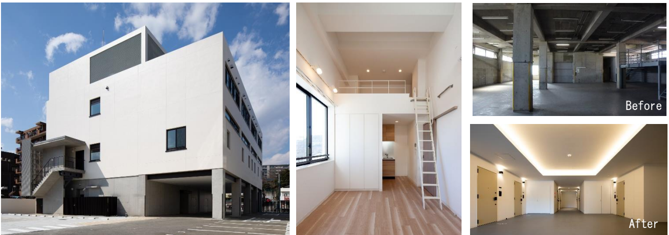
『レーヴマニフィック永山』既存建物を活かした外観・室内、共用部

郊外立地においてはその市場性や事業性から未だハードルが高いコンバージョンを、地域と地域需要に適用した地域病院の看護師寮・デイサービスセンターとして実現。既存建物の階高を活かした空間設計を行い、コミュニケーションを誘発する施設に再生しました。