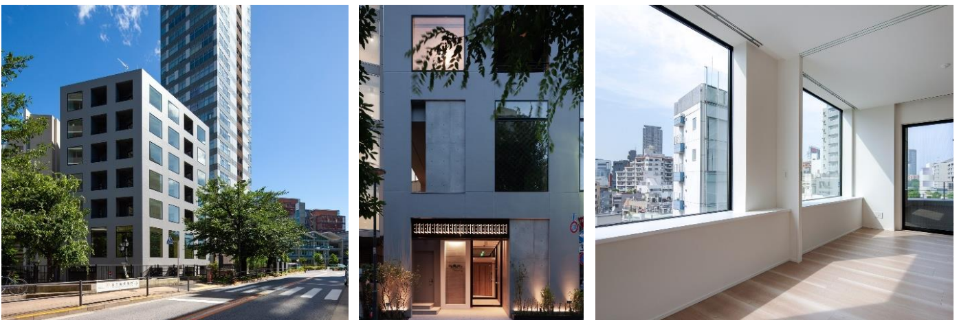
『ヘキサート六本木』集合住宅らしさを排除した外観・開放的な窓辺空間のある室内

働く、遊ぶ、暮らす、寛ぐなどの場所が混在しその各々が混ざり合う都市の建築物として、空間づくりのセオリーをゼロから見直し、集合住宅「らしさ」を極力排除し、多様な活動を支える建物を設計しました。