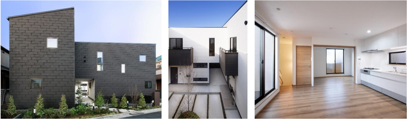
『Mitte Platz』 ゆるやかに街とつながり交流の場となる中庭、光と風を感じる室内

「街に開く」をテーマに、中庭を囲んで4住戸を配置し、中庭から四方に抜ける空間でつながりを設け、子育て世帯の入居者、近隣住民が「ほどよく」つながる親和性の高いデザインを設計しました。