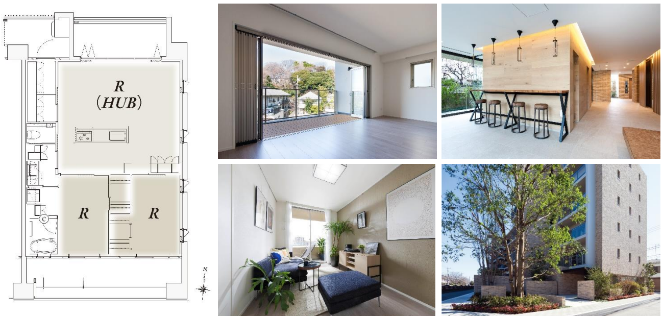
『イニシア池上』2人世帯を捉えた住戸ユニット・エントランスホール・外観

家族を「個」の集まりとして捉えなおし、玄関につながるリビング・ダイニングと、リビング・ダイニングに面した2つの個室、隣戸側に集約した水回りで住戸を構成。多様な住まい方を可能にする2人世帯住宅ユニットを提案しました。