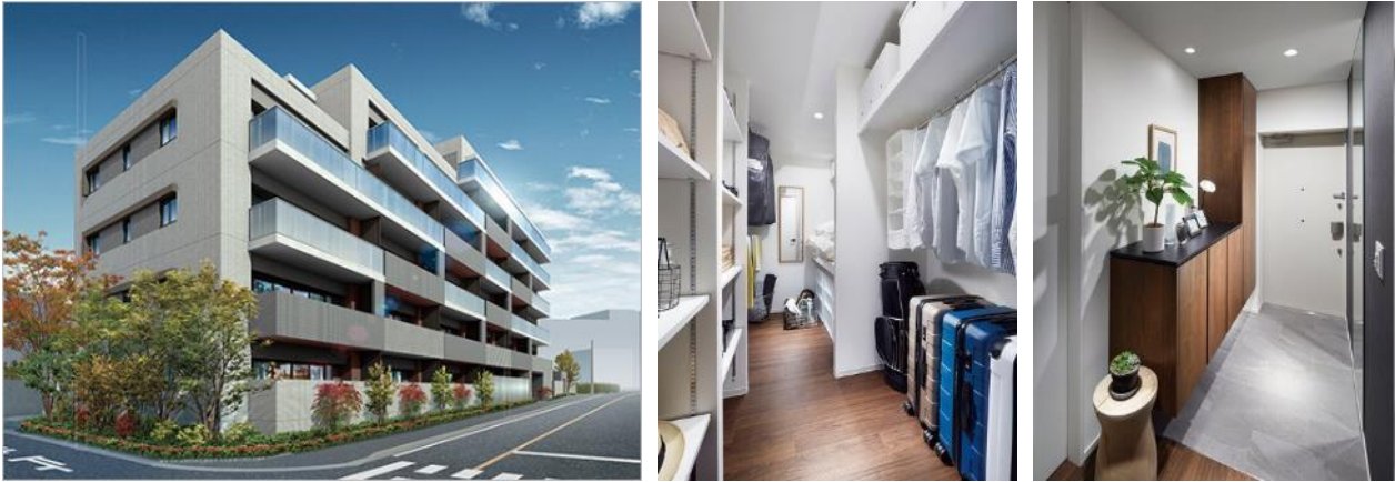
『イニシア志木レジデンス』外観完成予想図、モデルルーム・ファミリークローゼット、ウエルカムホール（玄関）