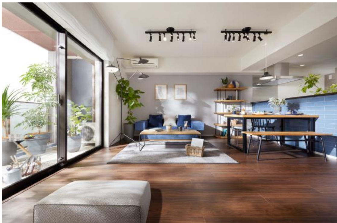
「イニシア志木レジデンス」モデルルーム

※ 5 路線とは東武東上線・東京メトロ副都心線・東京メトロ有楽町線・東急東横線・横浜高速鉄道みなとみらい線の 5 路線をさします。