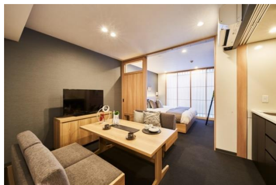
『MIMARU 京都 新町三条』客室

名称：MIMARU 京都 新町三条 運営会社：株式会社コスモホテルマネジメント 所在地：京都市中京区新町通三条上る町頭町 105 交通：京都市営地下鉄烏丸線・東西線「烏丸御池」駅徒歩 5 分 京都市営地下鉄東西線「二条城前」駅徒歩 9 分 施設：客室 69 室 構造・規模：鉄骨造 地上 5 階 敷地面積：1,046.88 m 2 建築面積：836.84 m 2 オープン：2018 年 11 月 8 日 (木) ホームページ： https://mimaruhotels.com/ja-jp/shinmachi-sanjo/