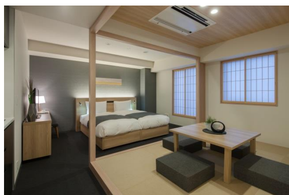
『MIMARU 東京 赤坂』客室

ホームページ： https://mimaruhotels.com/ja-jp/akasaka/