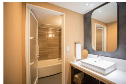
『MIMARU 東京 上野 NORTH』客室